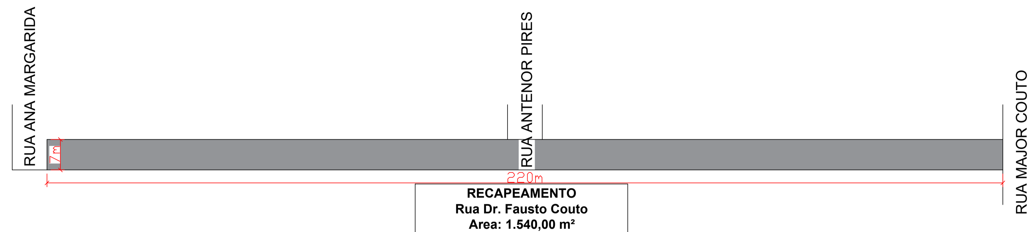
Detalhe 01 - Recapeamento Asfáltico (CBUQ)