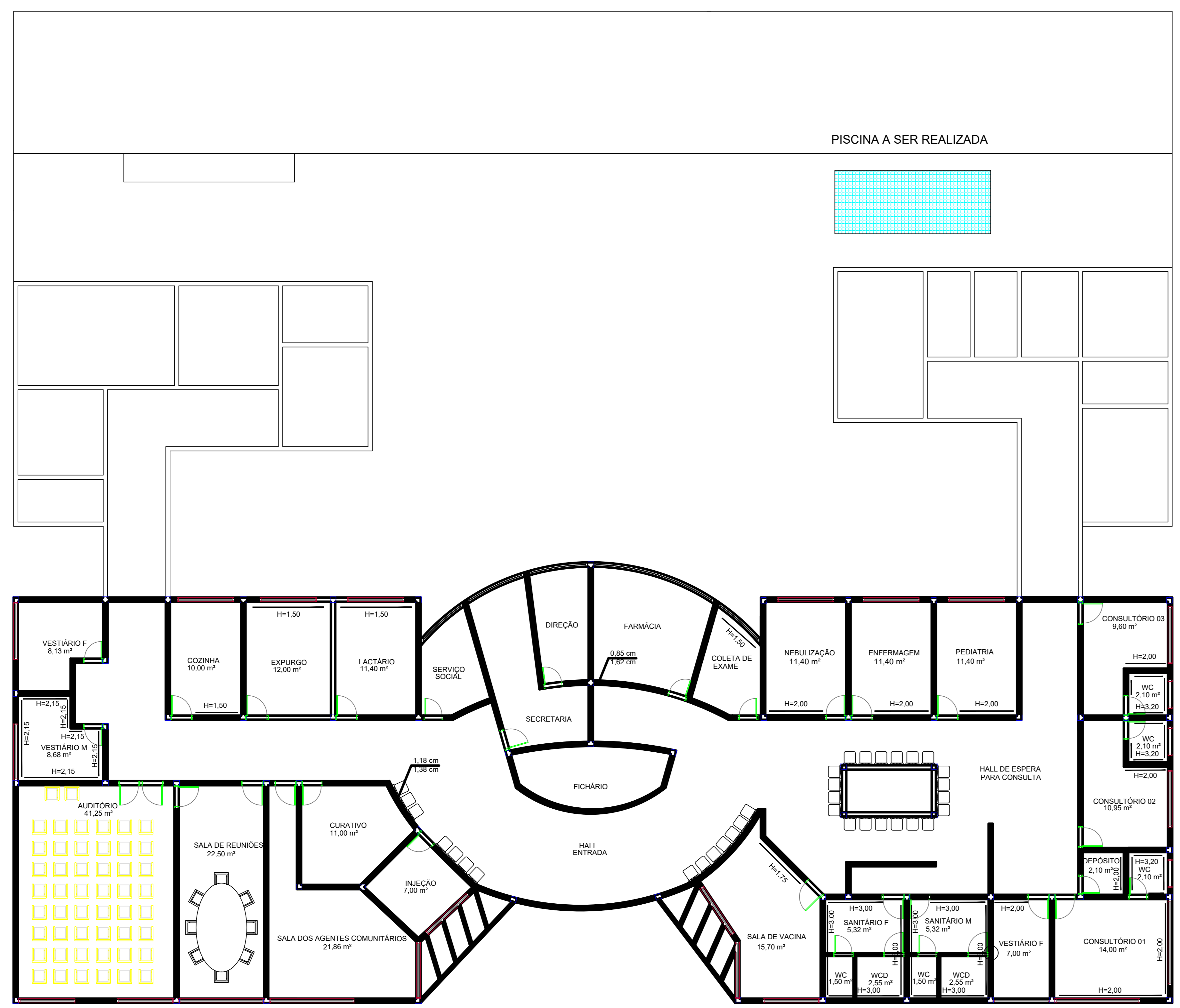
IMPLANTAÇÃO Esc. 1:100