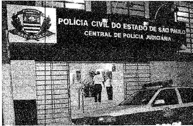
Fachada da CPJ (Central de Polícia Judiciária) de Marília; policiais civis do Estado são defendidos pela Adesp

"Em um primeiro momento, considerando o efetivo total de 23 mil policiais civis em todo o Estado, o número de casos pode não parecer alarmante. Entretanto, a Adesp alerta que esse número pode ser ainda maior, já que apenas os policiais civis da capital foram testados pelo governo. Com o avanço da doença pelo interior do Estado e sem a devida testagem e acompanhamento, o cenário poderá se agravar", informou a associação em nota.