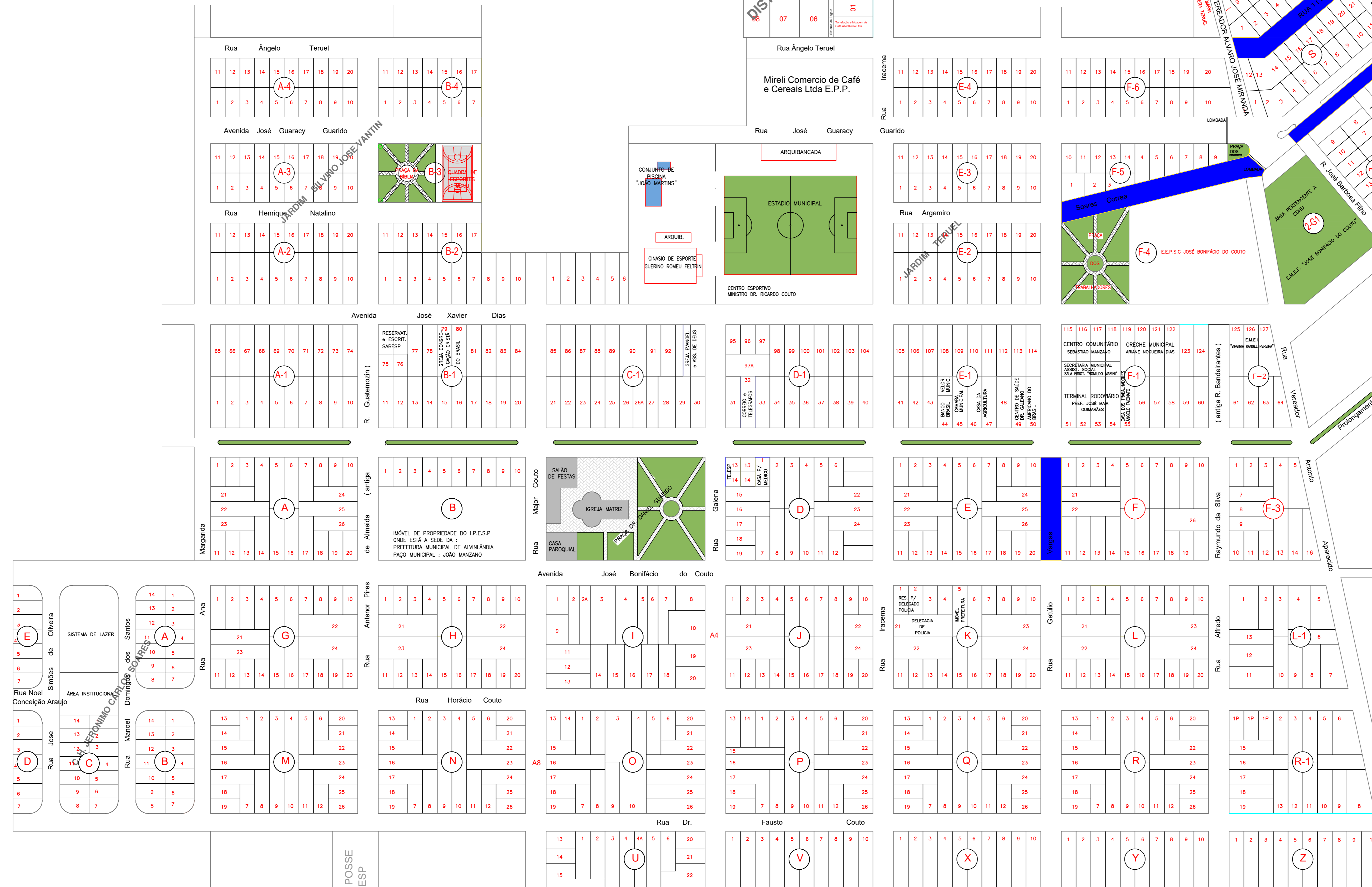
Detalhe 01 - Recapeamento Asfáltico (CBUQ)