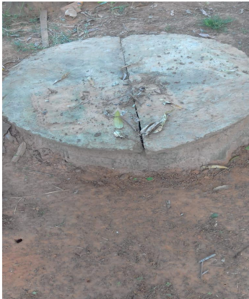
Figura 05 – Exemplo da situação atual das fossas nas propriedades rurais do município de Alvinlândia – SP na data de 10/03/2021.