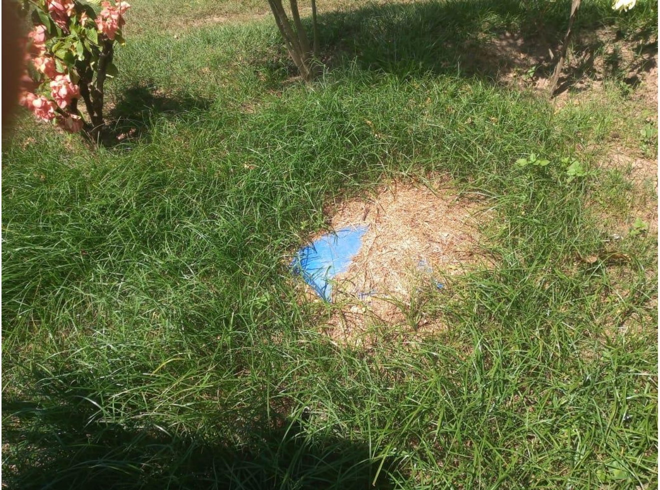
Figura 03 – Exemplo da situação atual das fossas nas propriedades rurais do município de Alvinlândia – SP na data de 10/03/2021.