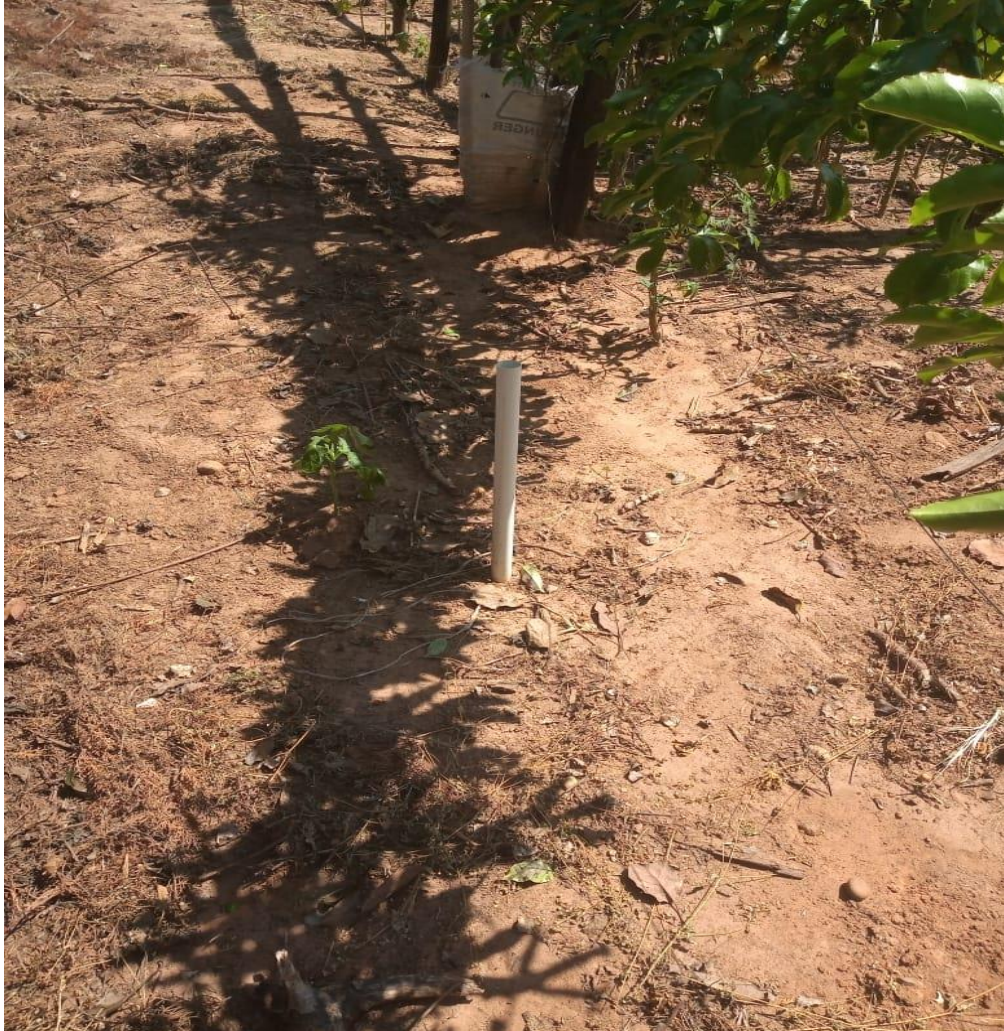
Figura 04 – Exemplo da situação atual das fossas nas propriedades rurais do município de Alvinlândia – SP na data de 10/03/2021.