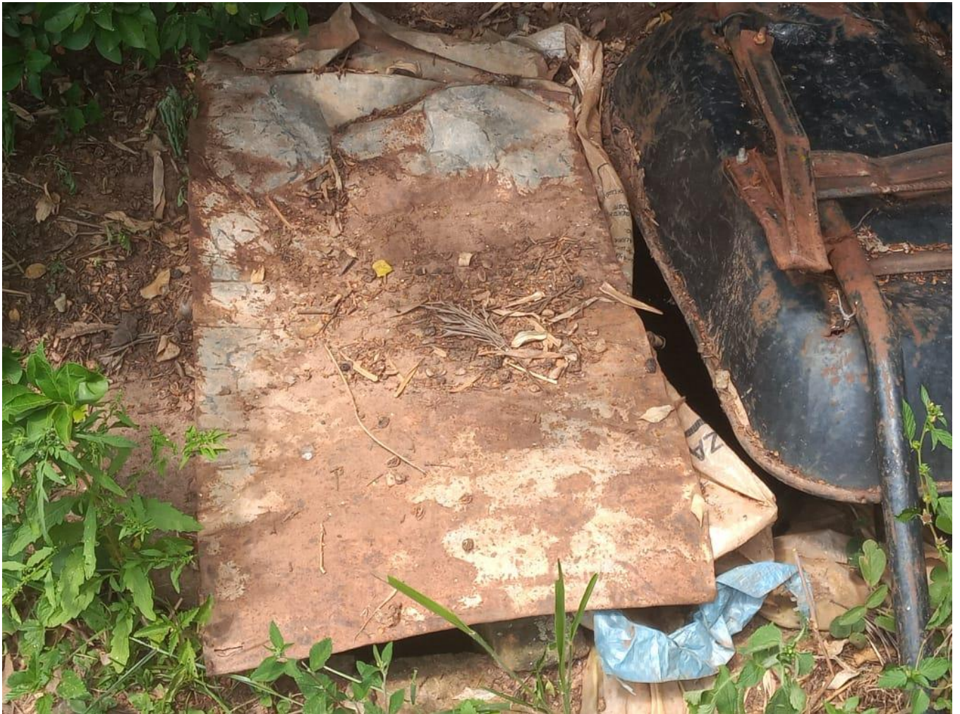
Figura 01 – Exemplo da situação atual das fossas nas propriedades rurais do município de Alvinlândia – SP na data de 10/03/2021.