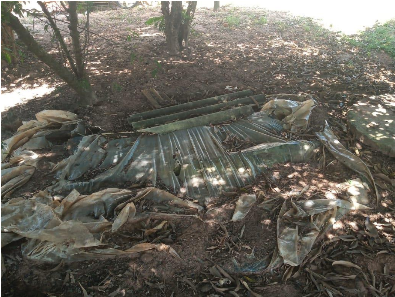
Figura 02 – Exemplo da situação atual das fossas nas propriedades rurais do município de Alvinlândia – SP na data de 10/03/2021.